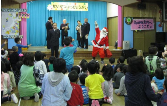
保育園でサンタさんとジャンケン大会