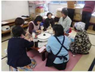
出張クッキング教室「かんたんビビンバ」