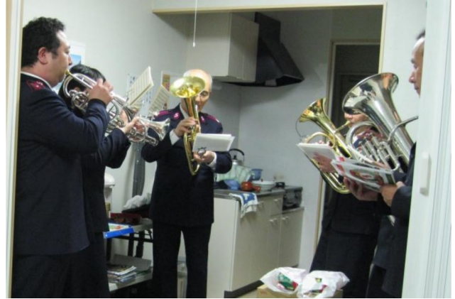
仮設団地内の部屋で待っていて下さった方々のため演奏